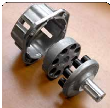
Giunto elastico incorporato per un migliore accoppiamento pompa/motore.